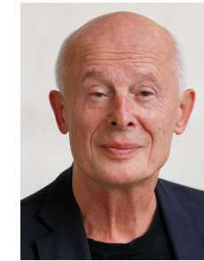
한스 요아힘 쉘른후버 Hans Joachim Schellnhuber