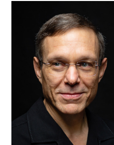
아비 로브 Avi Loeb