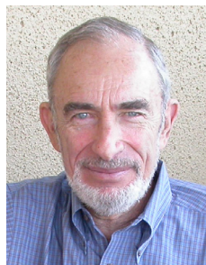
폴 R. 엘리히 Paul R. Ehrlich